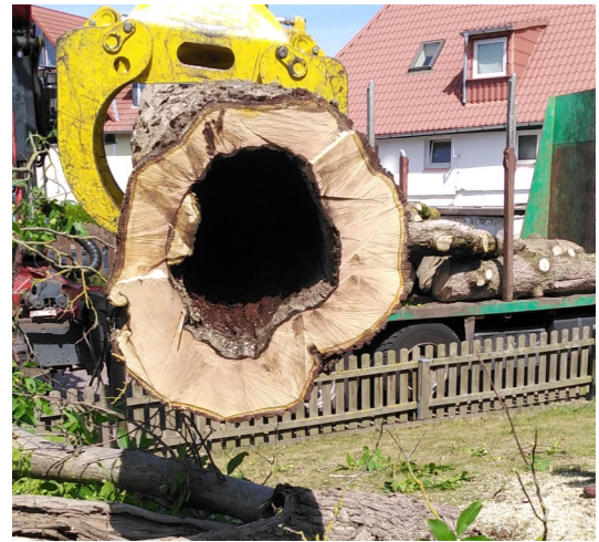
Ein Kind hätte sich in dem knietiefen Loch des Wurzelkerns verstecken können