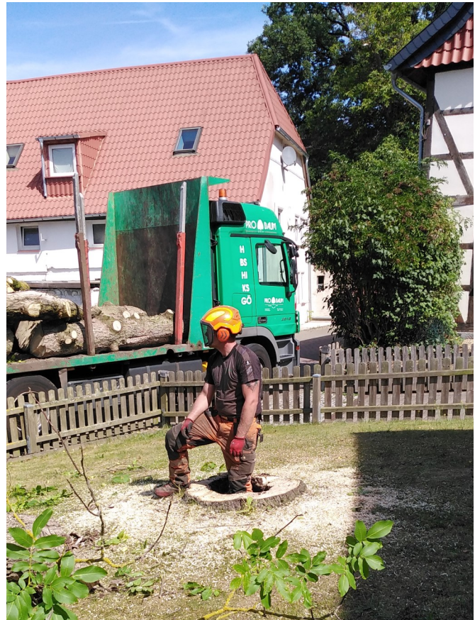
Text und Fotos: Femke Beckert