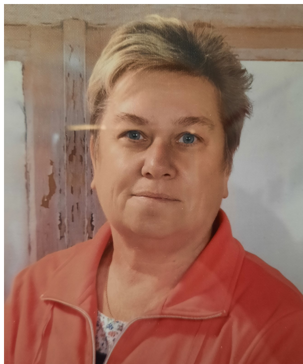
Deine Kolleginnen der Arche Noah

R uh dich aus! U nternimm tolle Dinge! H alte dich fit! E rkunde die Welt! S teh spät auf! T anze durchs Leben! A ngel dir ein Hobby! N utze die Zeit! D enk an uns!