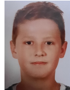
Theis Schmidt Mozartring 11